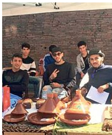
I giovani musulmani nel loro stand